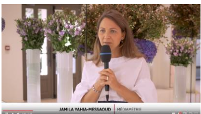
Interview dans la vidéo best-of de la conférence