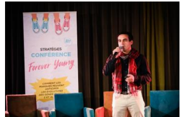
Intervention totalement intégrée à la demi-journée de conférences