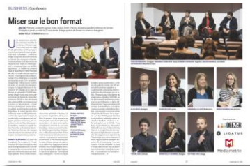
Votre logo sur la double page de compte rendu dans Stratégies