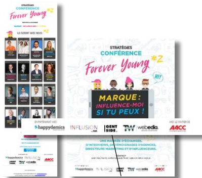
Visibilité sur les supports de communication