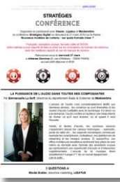
Tribune ou 3 questions à... dans l newsletter