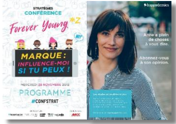
Page de publicité dans le programme