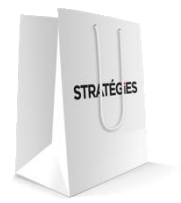
Diffusion de documents ou goodies dans le sac remis aux participants